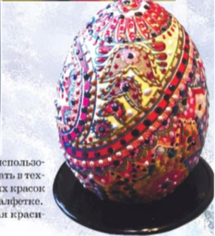
Рисунок на салфетке будет диктовать нам, какой цвет контура использовать, какие линии и элементы надо подчеркнуть, выделить и расписать в технике «Точечная роспись»! Совет. При подборе контурных акриловых красок обратите внимание, какие основные цвета присутствуют на вашей салфетке.

Распишите наше Пасхальное яйцо со всех сторон, подчёркивая красивые орнаменты салфетки! И вот ваш Пасхальный сувенир готов!