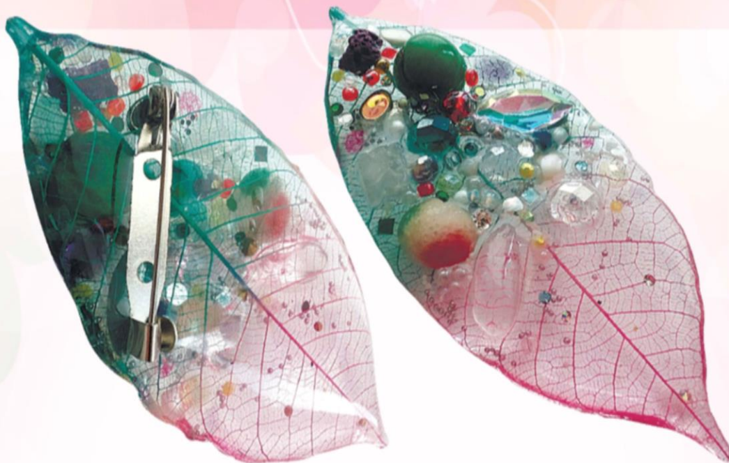
Смола высохла. Брошь-листочек готова.

ПРИ ПОДДЕРЖКЕ ФЕДЕРАЛЬНОГО АГЕНТСТВА ПО ПЕЧАТИ И МАССОВЫМ КОММУНИКАЦИЯМ