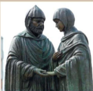
Памятник Петра и Февронии в г. Красноярске.

Все эти знания и символы собраны в одной работе, которую можно сделать и подарить семейной паре с самыми добрыми и светлыми пожеланиями.